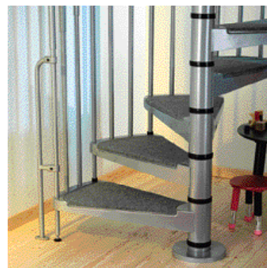
Nášľapy s kobercom