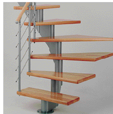
Zatočenie o 1/4 s nášľapmi v buku