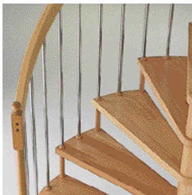
Kovové stĺpy tralkami.