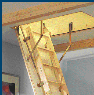
Stropné skladacie schody